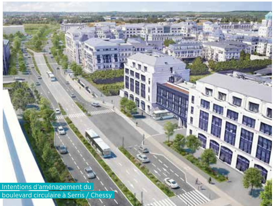
Intentions d'aménagement du boulevard circulaire à Serris / Chessy

Le projet de bus EVE (Esbly – Val d'Europe) a franchi une nouvelle étape le 11 février 2021, avec l'approbation du schéma de principe et du dossier d'enquête d'utilité publique par le Conseil d'administration d'Île-de-France Mobilités.