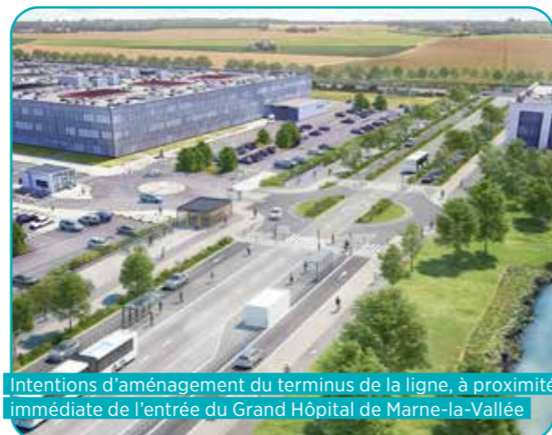
Intentions d'aménagement du terminus de la ligne, à proximité immédiate de l'entrée du Grand Hôpital de Marne-la-Vallée

Pour les cyclistes, l'aménagement d'un itinéraire sécurisé tout le long du tracé (ou à proximité immédiate au niveau du Pont Morris) est programmé. 400 places de stationnement vélos, dont 60 % en consigne (avec recharge électrique), seront installées à proximité immédiate des stations.