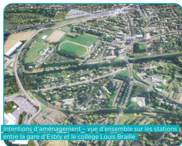
Intentions d'aménagement - vue d'ensemble sur les stations entre la gare d'Esblly et le collège Louis Braille