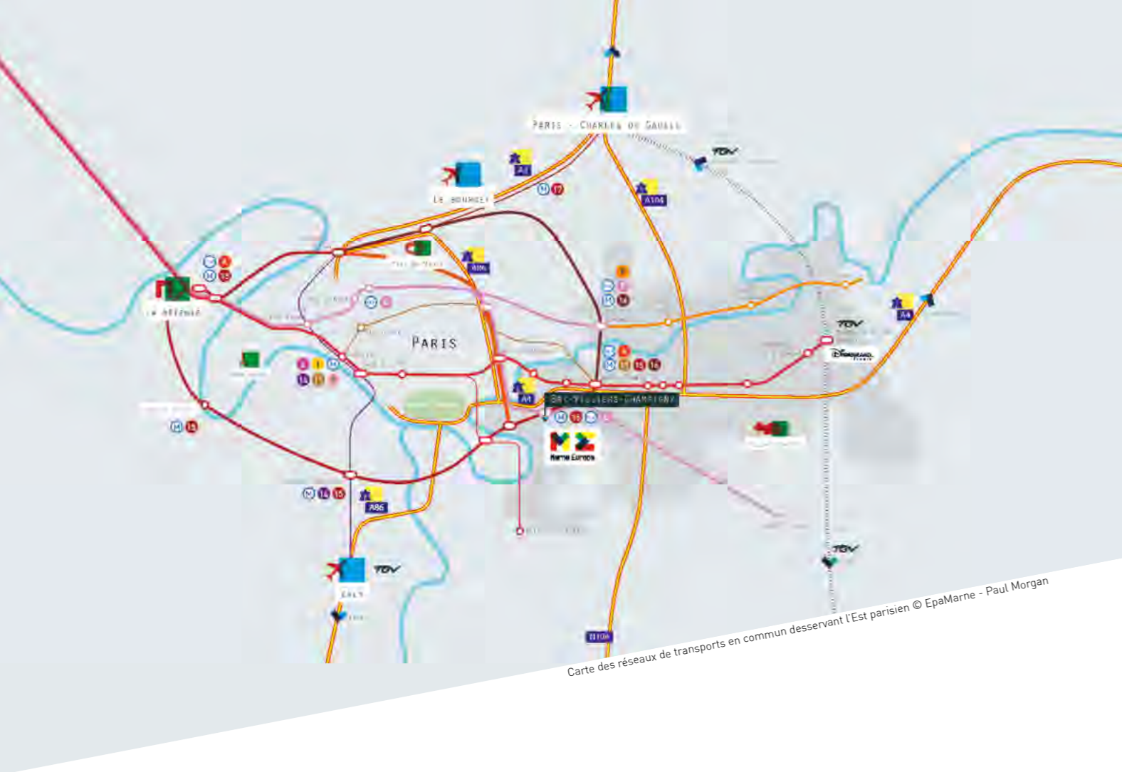
Carte des réseaux de transports en commun desservant l'Est parisien © EpaMarne - Paul Morgan