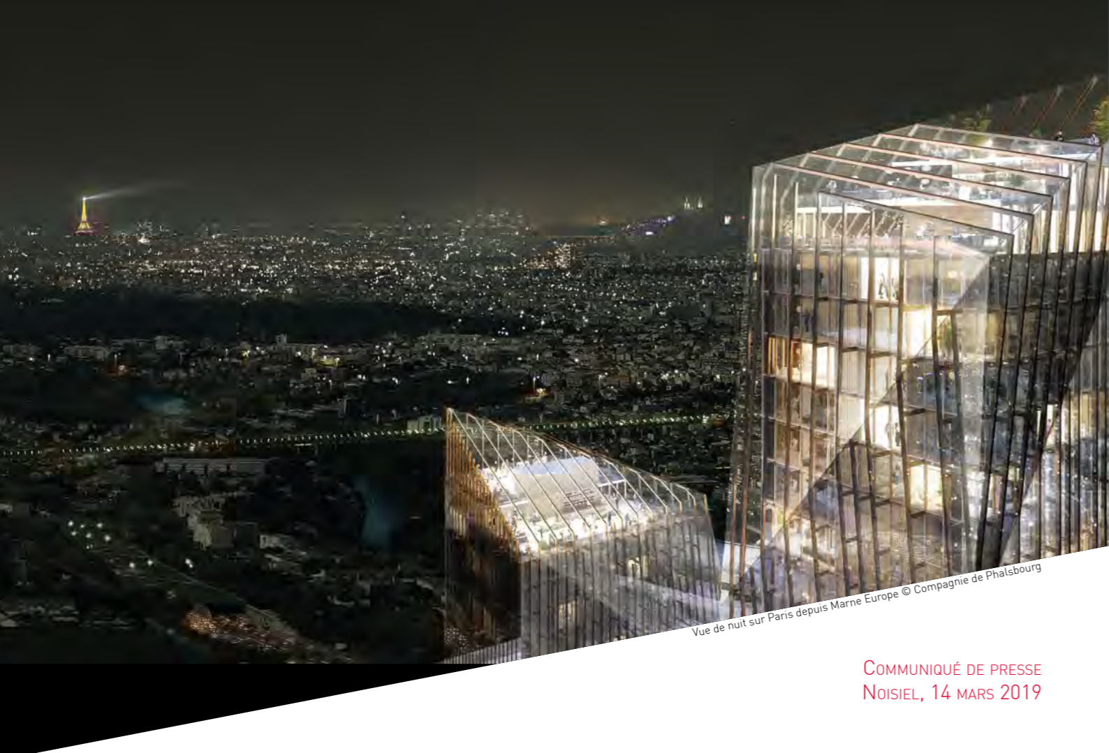
Vue de nuit sur Paris depuis Marne Europe

COMMUNIQUÉ DE PRESSE NOISIEL, 14 MARS 2019