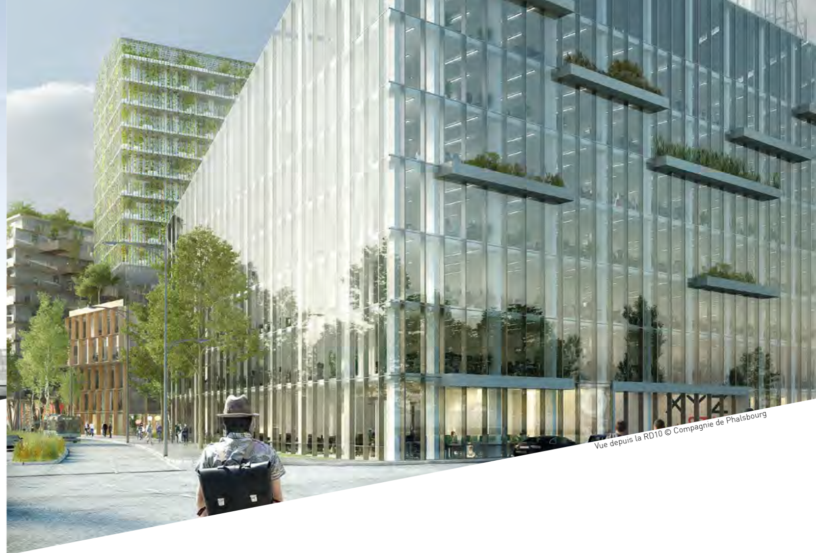
Vue depuis la RD10