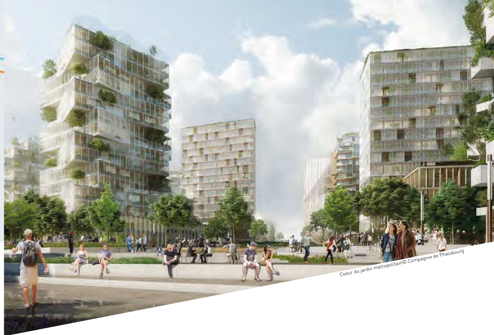
Coeur du jardin métropolitain © Compagnie de Phalbourg